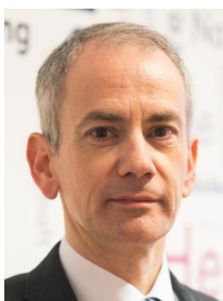
Dir. Mag. Andreas Jaklitsch Rotes Kreuz Steiermark