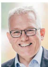
Mag. Thomas Spann Kleine Zeitung GmbH & Co KG